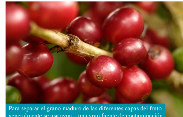
Para separar el grano maduro de las diferentes capas del fruto generalmente se usa agua – una gran fuente de contaminación.

Se busca optimizar el uso de fertilizantes para reducir emisiones y dar soporte financiero a productores que cambien su sistema a agroforestería, i.e. introduciendo nuevas especies de árboles en sus fincas.