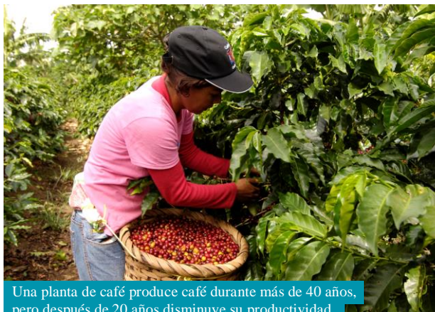
Una planta de café produce café durante más de 40 años, pero después de 20 años disminuye su productividad.

Con la NAMA Café se espera reducir emisiones de GEI y mejorar la eficiencia en el uso de los recursos a nivel de fincas y beneficios. Así se creará el primer café bajo en emisiones mundial, lo que dará acceso a mercados nuevos a caficultores costarricenses. El NAMA Support Project (NSP), financiado por la NAMA Facility, apoya la NAMA Café con asistencia técnica y financiera.