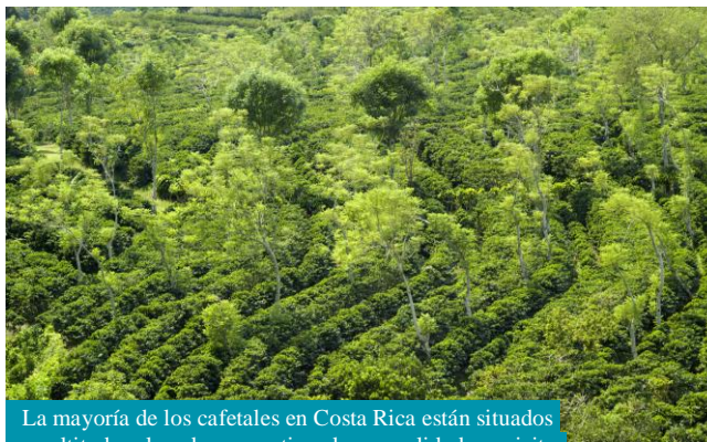
La mayoría de los cafetales en Costa Rica están situados en altitudes elevadas, garantizando una calidad exquisita.